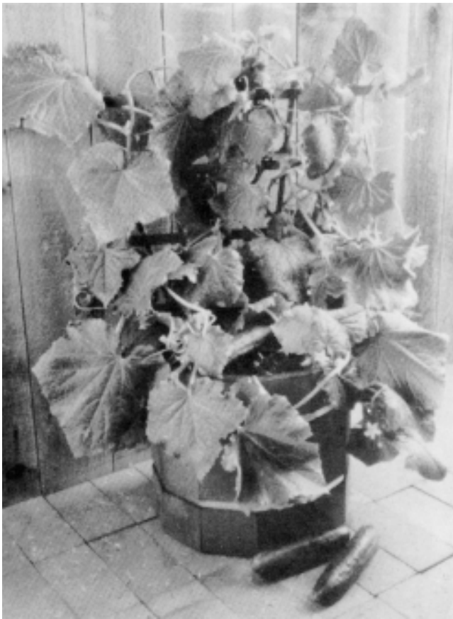
Los pepinos arbustivos, tal como 'Salad Bush,' se cultivan bien en recipientes.