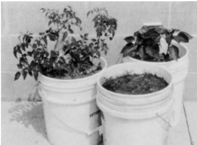
Casi cualquier tipo de recipiente se puede utilizar para cultivar las hortalizas si está limpia y provee buen drenaje.